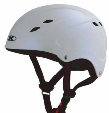
マジックホワイト